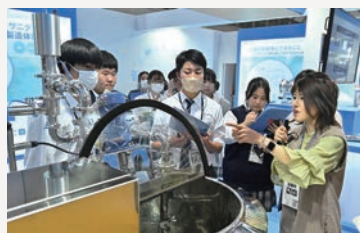
サニタリー機器の説明