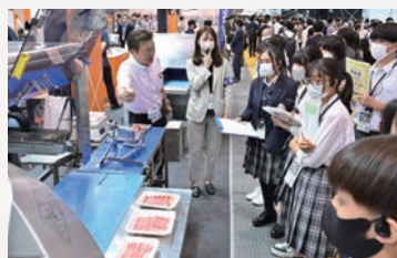
ミートスライサーの説明