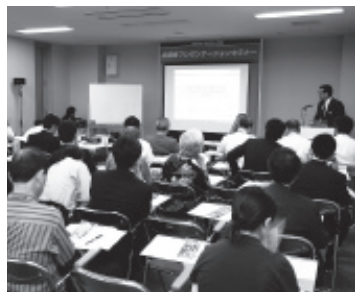
出展者プレゼンテーションセミナー

の機会にFOOMA JAPANでセミナーを実施してみませんか? セミナー実施出展者は、公式招待状に出展者名・テーマが掲載される他、公式ホームページにも情報が掲載されますので、多くの皆様にアピールすることが出来ます。セミナー終了後には受講者のお名刺を資料としてお渡します。強い関心をお持ちのお客様リストですので、展示会終了後の販促活動にお役立て下さい。